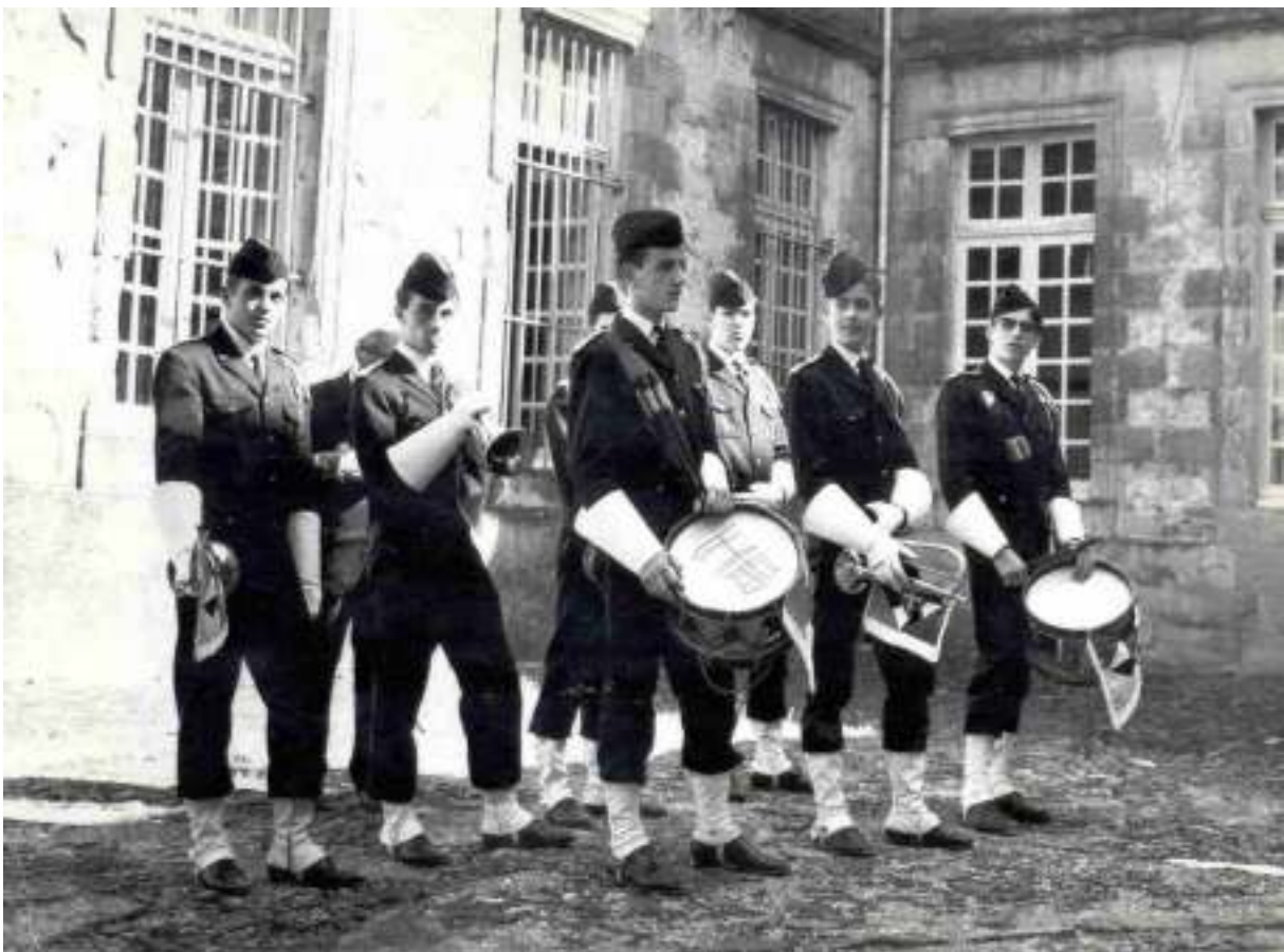
La clique en 1966