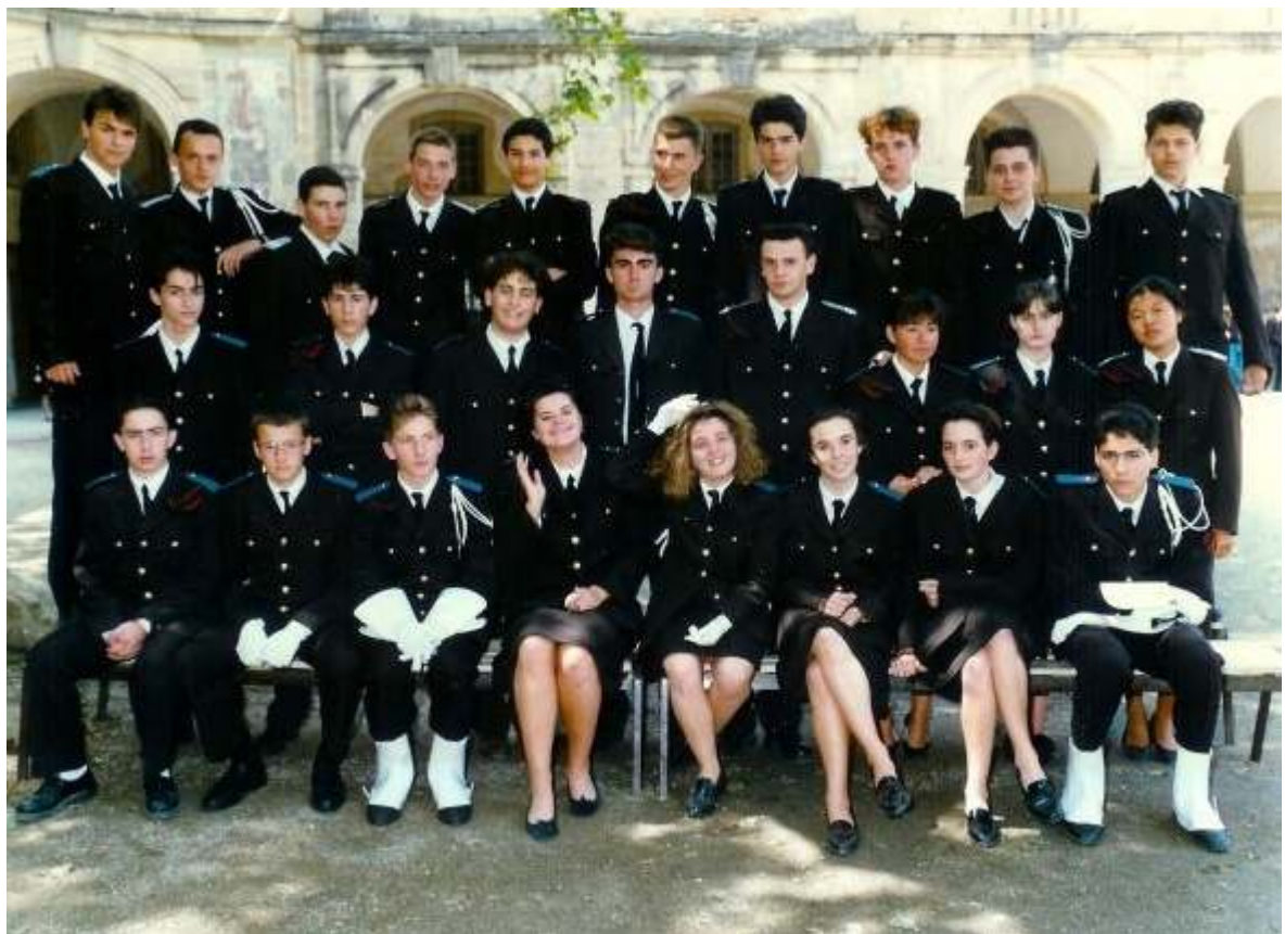
Une classe des Bleus en 1990-1991