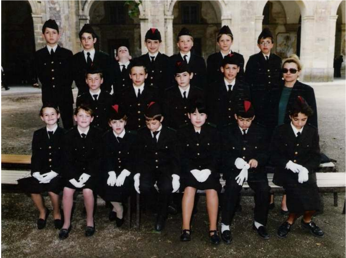
La classe de septième en 1989-1990