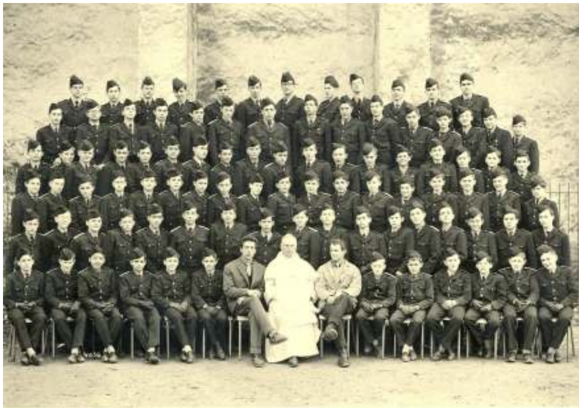
Ecole de Soreze Division des Collets Bleus: 1960/61

FOURIE & PETIT 15, av. P. S. Cassin 12000 NIMES