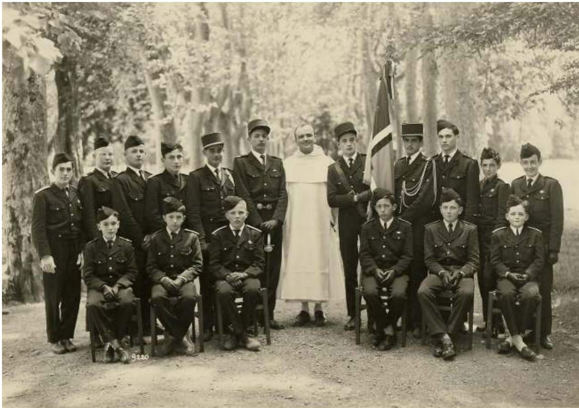
Ecole de Soreze 1957-1958

FOURIE & PETIT 15, av. P. S. Cassin 12000 NIMES