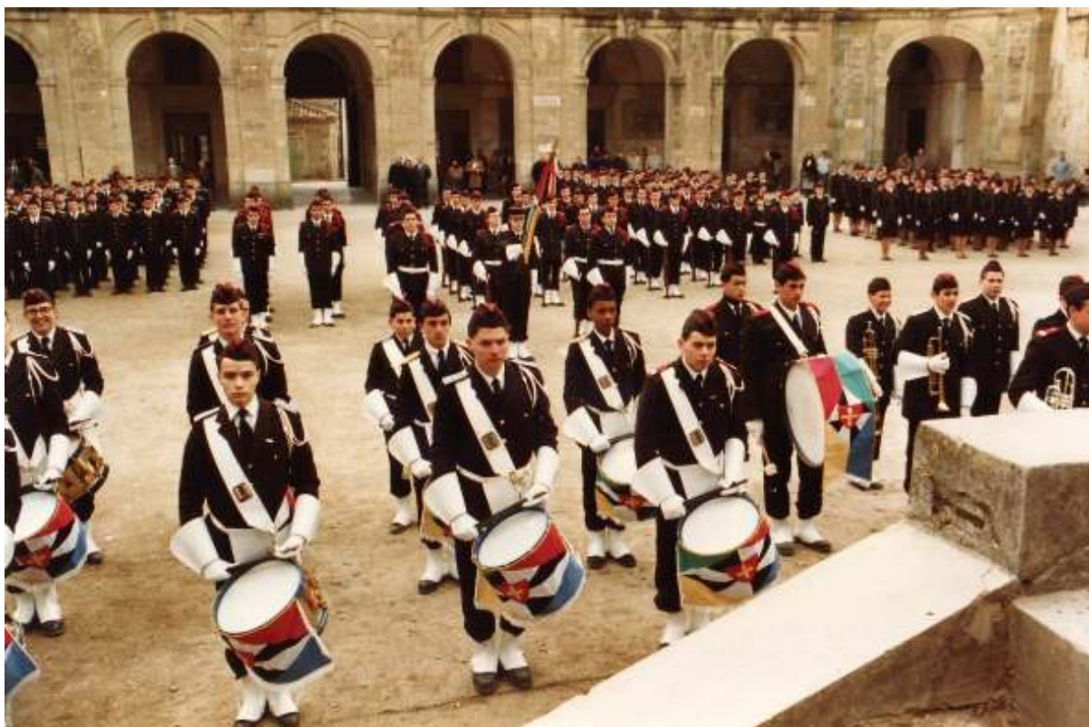
La fanfare en 1987-1988