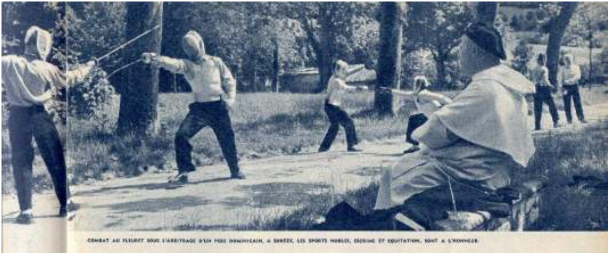
COMBAT AU FLEURET SOUS L'ARBITRAGE D'UN PÈRE DOMINIQUAIN, À SERRÈRE, LES SPORTS NOBLES, ENDRIQUE ET ÉQUITATION, SONT À L'HONNEUR.