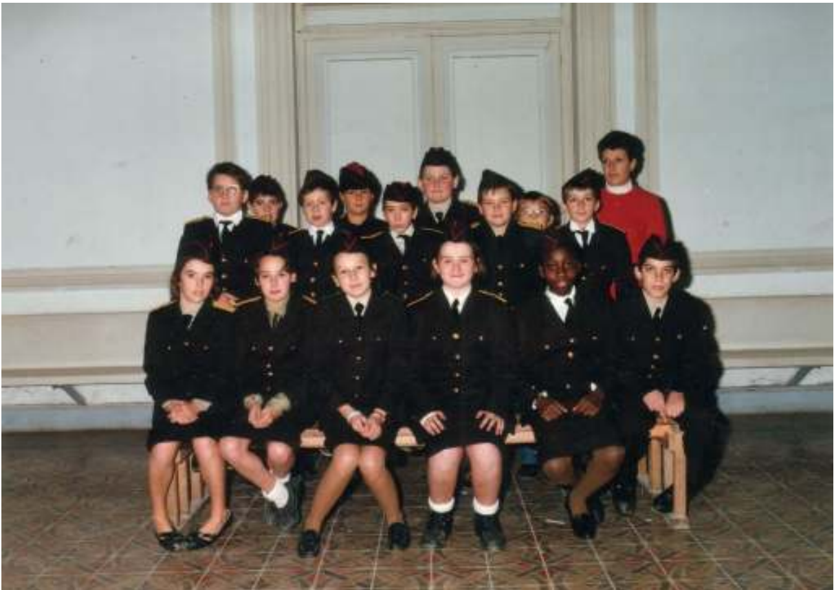
Classe de 5 ème 2 1987